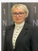
Каленик Светлана Эксперт

https://www.century21.ru/nedvizhimost/prodaza-5-komnatnoi-kvartiry-1273m2-35-etaz