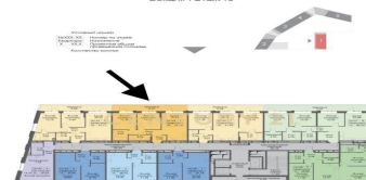
Секция 1 Этаж 16

Арт. 67377293 ЖК FORST. Видовая квартира, высокий этаж, своя терраса. Аналогичная соседняя квартира у застройщика стоит 32,6 млн. руб (на 3 фото скрин). 2-х комнатная квартира в 1 корпусе в доме бизнес-класса с собственной большой террасой (не балкон/лоджия). Таких квартир в проекте мало! Вид на реку из всех окон. Видовые характеристики и расположение квартиры есть на фото. Функциональная планировка формата евро-3. Без отделки. Площадь квартиры с учетом террасы 72 м(2). Дом на высокой стадии готовности, сдается во II квартале 2024 года, ключи в ноябре. Переуступка. Полная стоимость в договоре. Быстрый выход на сделку. >> https://www.century21.ru/nedvizhimos/moskva-prodaza-2-komnatnoi-kvartiry-71m2-1620-etaz