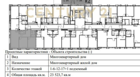
Схема расположения квартиры на этаже:

Проектные характеристики - Объект строительства (1)