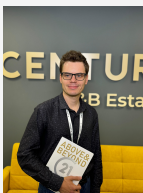
Песков Феликс Агент

Просторная 3-х комнатная квартира, общей площадью 58,4 кв.м., 4 этаж из 5. Комнаты раздельно, с/у совместно, окна выходят на обе стороны. Хорошие соседи, развитая социальная инфраструктура, расположение в историческом центре, транспортная доступность, множество парков и прогулочных зон. В шаговой доступности метро улица 1905, метро Шелепиха, Парк Красная Пресня, Красногвардейские пруды, детские площадки, школы, детские сады, поликлиники, аптеки, супермаркеты, фитнес клубы. Документы - приватизация, мама и дочь (все согласны на продажу). Арт. 72152257 >> https://www.century21.ru/nedvizhimost/moskva-prodaza-3-komnatnoi-kvartiry-617m2-45-etaz