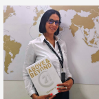
Цива Александра Эксперт

ЦЕНА НИЖЕ, ЧЕМ У ЗАСТРОЙЩИКА БЕЗ ОТДЕЛКИ!!! УНИКАЛЬНЫЕ ПРЕИМУЩЕСТВА КВАРТИРЫ: 1. КЛЮЧИ в день СДЕЛКИ 2. КУХНЯ-ГОСТИНАЯ с лоджией с панорамным остеклением! 3. КОЛЯСОЧНАЯ на 1 этаже 4. СПУСК НА ЛИФТЕ В ПАРКИНГ! 5. Приятный и нескучный дизайн! 7. ВАМ ОСТАНЕТСЯ ВСЁ ОСНАЩЕНИЕ ХАРАКТЕРИСТИКИ КВАРТИРЫ: ПРОСТОРНАЯ КУХНЯ с выходом на лоджию, с видом на променад! САМУЗЕЛ с теплым полом! ВАННА-натяжной потолок, акриловая ванна, отделка керамической плиткой, светильники и теплый пол. ИДЕАЛЬНОЕ НАПОЛЬНОЕ ПОКРЫТИЕ НА ОКНАХ установлены «детские замки» для гарантированной безопасности ДОКУМЕНТЫ: ОДИН СОБСТВЕННИК, Все документы готовы для выхода на сделку. Если вам необходимо одобрить ипотеку под покупку: ОДОБРЕНИЕ ПО САМОЙ НИЗКОЙ СТАВКЕ на вторичную недвижки... >> https://www.century21.ru/nedvizhimost/prodaza-1-komnatnoi-kvartiry-315m2-810-etaz