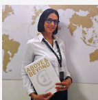
Цива Александра Эксперт

https://www.century21.ru/nedvizhimost/prodaza-doma-442m2-2-komnaty-1-etaz