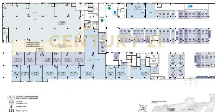
МНОГОФУНКЦИОНАЛЬНЫЙ КОМПЛЕКС 1-ОЙ ОЧЕРЕДИ КОМПЛЕКСНОЙ ЗАСТРОЙКИ ПЛАН 1 ЭТАЖА

Арт. 84727639 Продажа помещения в новостройке площадью 1080,1 м2 на 1-м этаже бизнес-квартала "Прокшино". Выделенная мощность 90 кВт, ХВС, ГВС, канализация. Уникальные офисы класса А, отвечающие мировым экологическим нормам при строительстве и выборе материалов, при эксплуатации объекта! Помещение свободного назначения под любой вид деятельности (медцентр, салон красоты, парикмахерская, офис, ресторан, бар, банк, бытовые услуги, торговое помещение, магазин и т.д.) Чтобы получить ПОДРОБНУЮ ПРЕЗЕНТАЦИЮ С ПЛАНИРОВКОЙ И ФОТОГРАФИЯМИ, звоните или отправьте свой email и номер телефона в сообщении на портале.