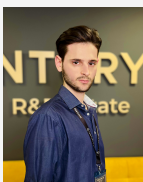
Кантарович Даниэль Агент

Продается 2-комнатная квартира 58,5 м 2 Красногорский бульвар, д. 23, 20 этаж. О КВАРТИРЕ Просторная 2-комнатная квартира с панорамным видом на реку. Общая площадь 58,5 м 2 , свободная планировка — можно реализовать любые дизайнерские идеи. Лоджия и отдельный санузел. Квартира с лёгкой отделкой — идеальный вариант для быстрого старта ремонта под свой вкус. Центральное отопление и горячее водоснабжение. О ДОМЕ 29-этажный кирпично-монолитный дом с современными коммуникациями. Высокий этаж гарантирует тишину и потрясающие виды из окон. На территории дома предусмотрены детские и спортивные площадки. О РАЙОНЕ Развитая инфраструктура: магазины, школа, детский сад, поликлиника, аптека, салоны красоты. В шаговой доступности — Митинский парк, благоустроенная... >> https://www.century21.ru/nedvizhimost/prodaza-2-komnatnoi-kvartiry-585m2-2030-etaz